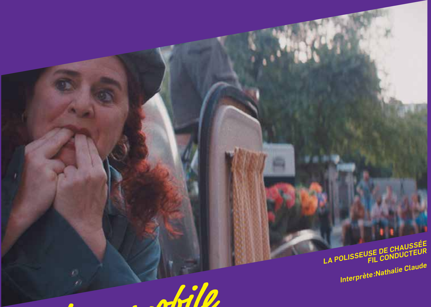
LA POLISSEUSE DE CHAUSSÉE FIL CONDUCTEUR