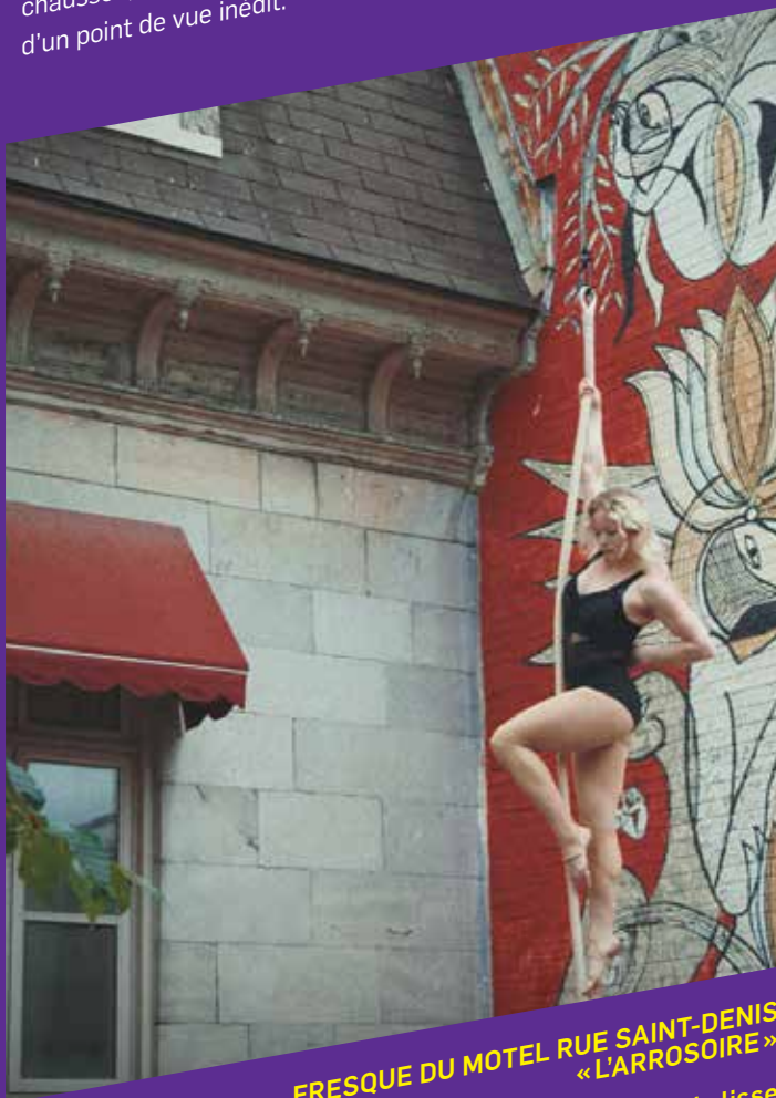
FRESQUE DU MOTEL RUE SAINT-DENIS « L'ARROSOIRE »

ici.tou.tv/montreal-presque-cirque-au-hasard-de-la-ville pour visionner les courts métrages :