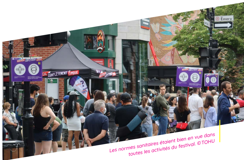
Les normes sanitaires étaient bien en vue dans toutes les activités du festival.

Nous nous considérons privilégiés d'avoir pu travailler ce Plan de sécurité sanitaire COVID-19 global avec plusieurs acteurs du calendrier estival, tels que le Bureau des festivals et des événements culturels, le CCMU et le Partenariat du Quartier des spectacles.