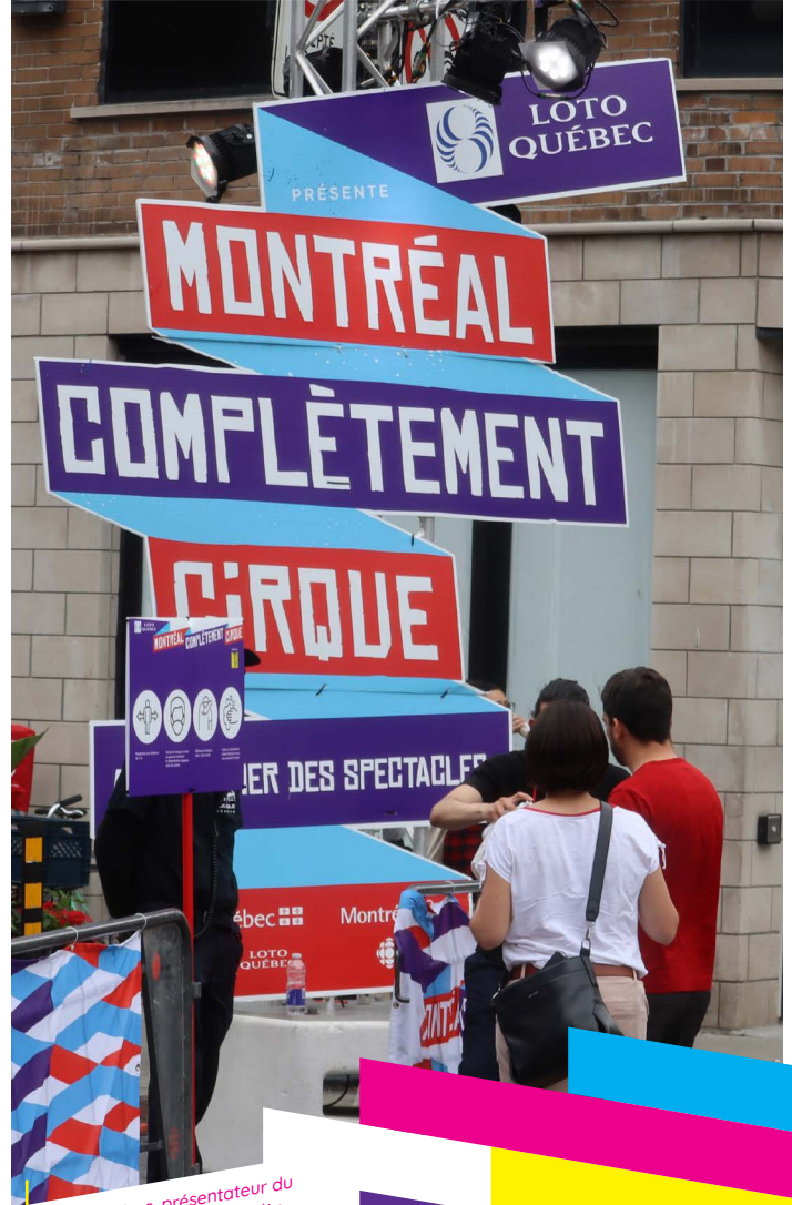
Loto-Québec, présentateur du festival, était bien en vue dès l'arrivée du public.