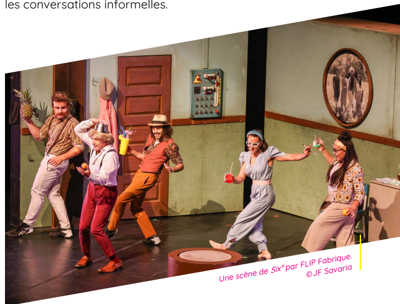
Une scène de Six par FLIP Fabrique.

Les Causeries d'artistes ont exposé la programmation de l'édition 2021 du festival MCC, offrant des plongées en profondeur dans chacune des 6 productions présentées au festival.