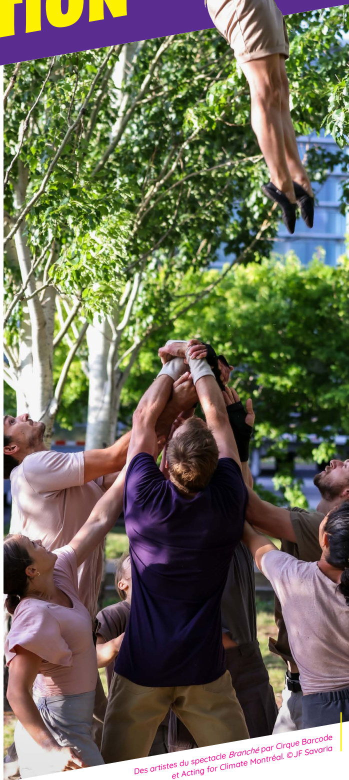
Des artistes du spectacle Branché par Cirque Barcode et Acting for Climate Montréal.

En conclusion, cette édition est un succès pour le festival, en dépit des nombreuses contraintes et difficultés surmontées par les équipes de MCC et par les artistes eux-mêmes. Le festival a réussi à poursuivre sa mission et reste plus que motivé à étendre sa croissance de fréquentation et développer de futurs projets plus ambitieux.