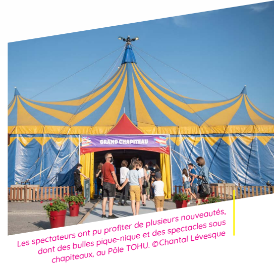
Les spectateurs ont pu profiter de plusieurs nouveautés, dont des bulles pique-nique et des spectacles sous chapiteaux, au Pôle TOHU.