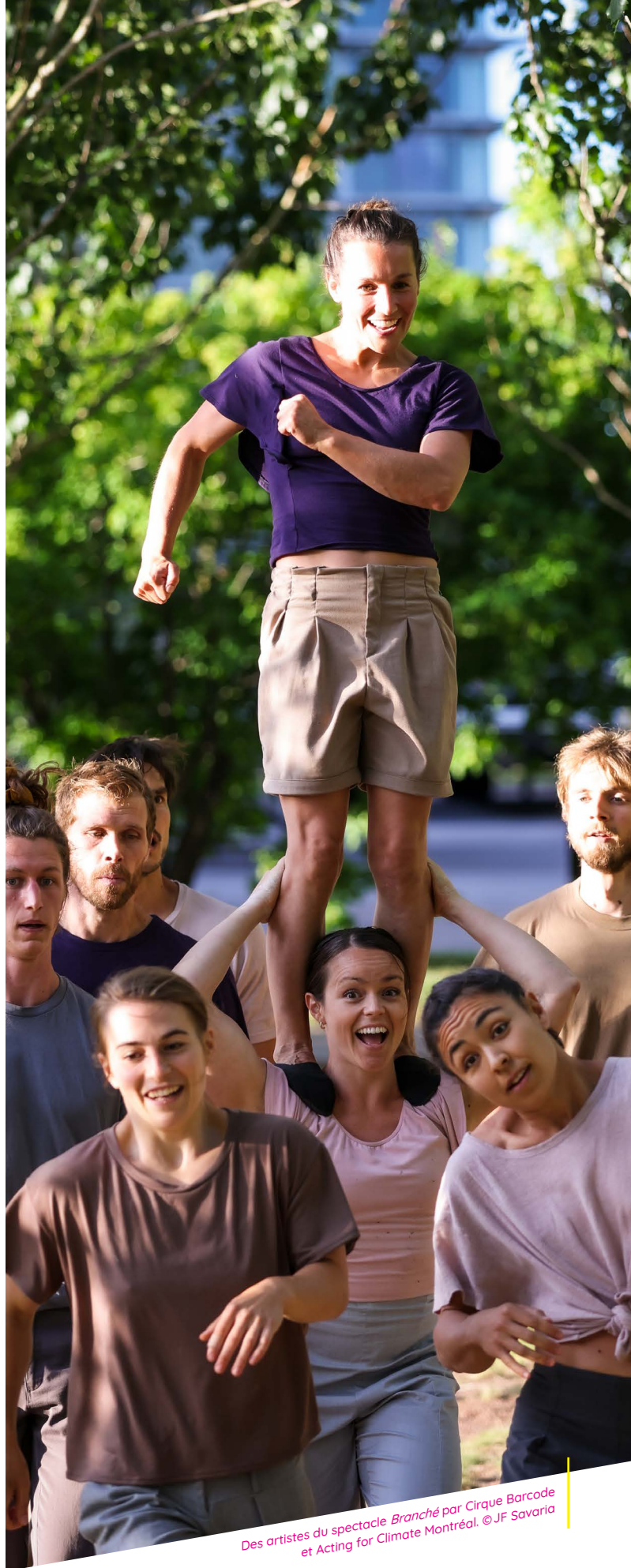
Des artistes du spectacle Branché par Cirque Barcode et Acting for Climate Montréal.

Le MICC, quant à lui, a exceptionnellement bénéficié d'une aide du Secrétariat québécois aux relations canadiennes, ainsi que de certains autres programmes de coopération (MRI notamment) de façon ponctuelle. Cela dit, il reste principalement autofinancé (fonds propres TOHU, inscriptions tarifées) malgré son impact démontré sur le développement de la discipline et sur les exportations. Un soutien pluriannuel pour l'aide aux vitrines artistiques serait vivement attendu.