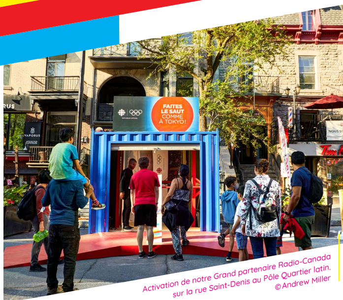
Activation de notre Grand partenaire Radio-Canada sur la rue Saint-Denis au Pôle Quartier latin.

LOTO-QUÉBEC A ÉGALEMENT CRÉÉ DU CONTENU AFIN DE PROMOUVOIR SON PARTENARIAT AVEC LA TOHU POUR LA 12 E ÉDITION DU FESTIVAL.